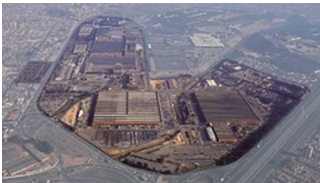
Mercedes-Benz in Brasilien