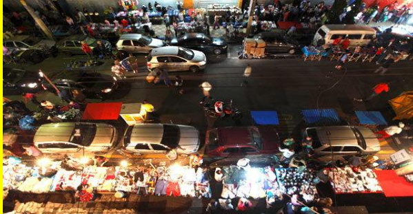
Brasilien bis in die Nacht im Kaufrausch