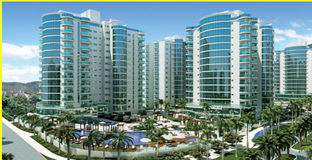
Der Immobilienmarkt in Brasilien befindet sich weiterhin im Rekordhoch. Die Nachfrage ist kaum zu befriedigen.