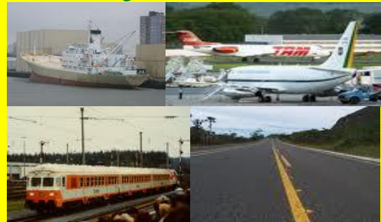
Ausbau und Bau von Häfen, Flughäfen, Fernbahnen, Stadtbahnen und Straßen